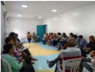
Fórum Regional de Assistência Social

Resultados Esperados: Ter ampliada a capacidade de escolha, de decisão, avaliação, de expressão e reivindicações; Aumento de acessos a serviços socioassistenciais