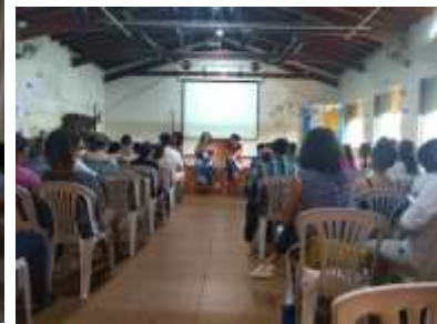
Conferência de AS Norte